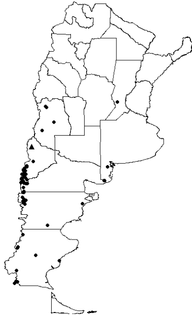
Figura 1: Distribución actual (2009) de la Vespula germanica en Argentina (Masciocchi en preparación).