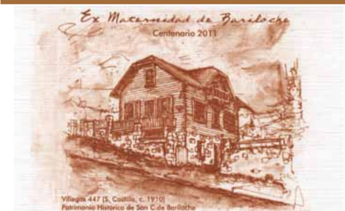
Villegas 447 [S. Castillo, c. 1910] Patrimonio Histórico de San C. de Bariloche

Sabemos que traer a la memoria historias y recuerdos hace bien al alma. Cuando uno integra las luces y las sombras del pasado abre la posibilidad de crecer y proyectarse hacia el futuro.